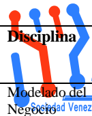
Tabla I: Artefactos de RUP-GDIS